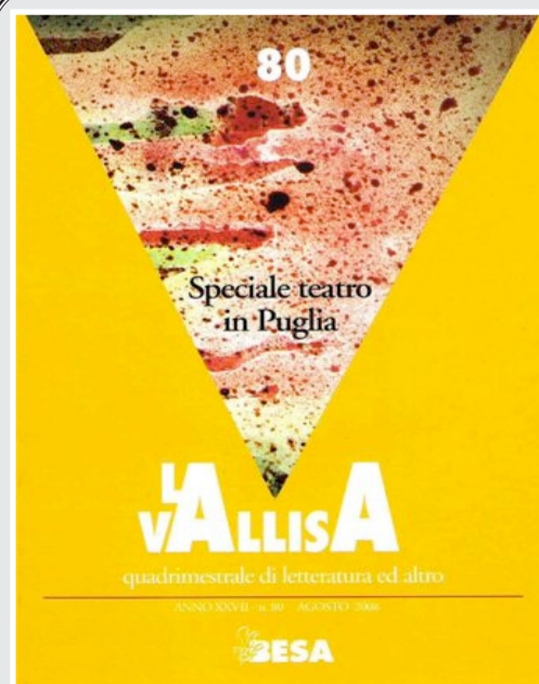
La copertina della rivista